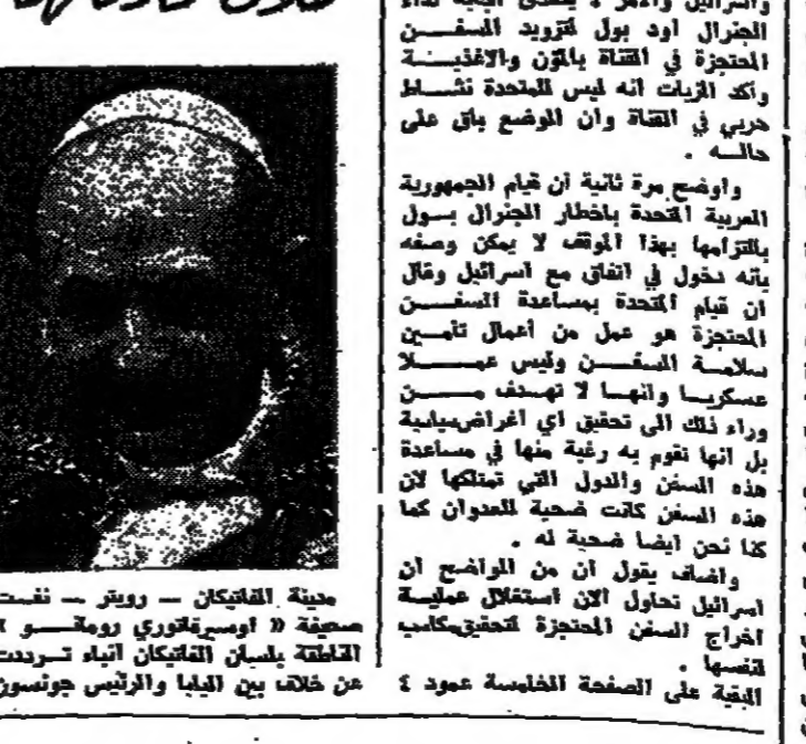
حيتة القاتكان - رويتر - نفت صحيفة « اوسبيكوري رومكو » المتعلقة بلسان القاتكان انباء تحريمت عن خلاف بين اليابا والرئيس جونسون في محادثات اجريها حول فيتنام .

زيارة برجيف للاممتحدة لم تؤجل لان موعدها لم يحدد اصلا موسكو - رويتر - ذكرت مصادر دبلوماسية عربية مصادر سوفيانية مأثورة هنا انه لم يحدد موعد لزيارة اريدا من المحتل ان يتوجه المستر برجيف الى القاهرة في وقت لاحق من هذا الشهر او مطلع شباط القادم ولكنها رجحت ان تتم الزيارة في اذار . وأضافت المصادر تقول انه اذا لم تطرأ عقبات في آخر لحظة فان المستر كيريسل زاووروف التائب الاول لرئيس ابلنتيه صحيفة « الأهرام »